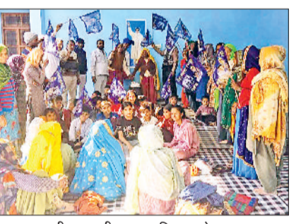
महेंद्रगढ़। कुमारी मायावती का जन्मदिन मनाते हुए।