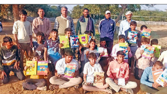
नारनौल। विजेता खिलाड़ियों को सम्मानित करते हुए।