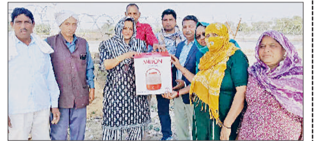
महेंद्रगढ़। विजेता खिलाड़ी को सम्मानित करते हुए।

महिला दौड़ में मंजू, बंटी और बबली, मटका दौड़ में बबली, रीना और मनीषा, लेमन रस में शकुंतला, रेशम विजेता रही। इस दौरान विजेता खिलाड़ियों को पानी के कैंपर, पानी बोतल, जग और कप गिलास सेट भेंटकर सम्मानित किया। इन खेलों को आयोजन कमेटी ने अपने