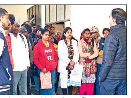
नारनौल। रोजगार मेले में उपस्थित प्रार्थी।