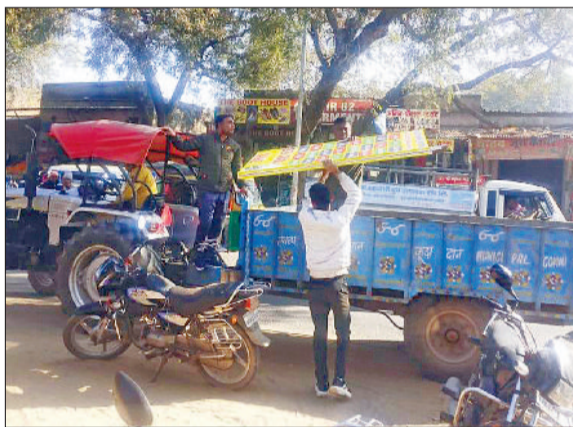
कनीना। अतिक्रमण हटवाते नपा कर्मचारी तथा नपा दस्ते से उलझते दुकानदार।