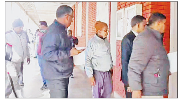
नारनौल। आरोपितों को कोर्ट ले जाती पुलिस।

मंडल की ओर से कार्यक्रम की शुरुआत 16 जनवरी को सुबह साढ़े आठ बजे गोशाला से कलश यात्रा के साथ कार्यक्रम शुरू होगा। यात्रा गोशाला से मोहल्ला जवाहर नगर, टेलीफोन एक्सचेंज, सराफा बाजार, परशुराम चौक व मसानी चौक होते हुए वापस गोशाला में पहुंचेगी। इसके बाद सुबह 11 बजे 108 कुंडीय हवन किया जाएगा और दोपहर दो बजे से सवा चार बजे तक गोभागत कथा आयोजित की जाएगी। प्रतिदिन हवन और कथा का समय एक समान रहेगा। 23 जनवरी को कथा के बाद कार्यक्रम का समापन किया जाएगा।