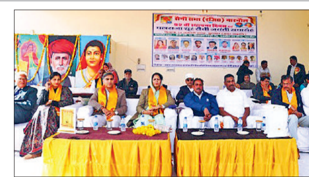
नारनौल। कार्यक्रम में मौजूद अतिथिगण व समाज के लोग तथा समारोह में सांस्कृतिक कार्यक्रम प्रस्तुत करती छात्राएं।