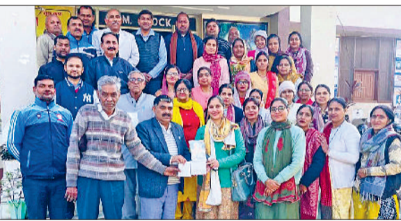
महेंद्रगढ़। प्रशिक्षण कार्यक्रम में उपस्थित शिक्षक।