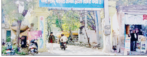
नारनौल। नगर परिषद कार्यालय।

उल्लेखनीय है कि स्वच्छ सर्वेक्षण की शुरुआत प्रधानमंत्री नरेंद्र मोदी सरकार में वर्ष 2016 में की शुरूआत की गई थी, जिसे आवास और शहरी मामलों के मंत्रालय द्वारा स्वच्छ भारत मिशन के तहत भारत के शहरों में स्वच्छता और ठोस अपशिष्ट प्रबंधन की स्थिति का आंकलन करने के लिए शुरू किया गया था। यह विश्व का सबसे बड़ा